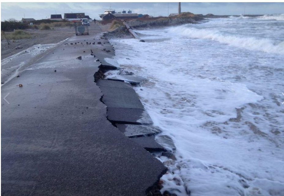
Nordstrandvej under storm

Det er en naturlig proces, at havet flytter rundt på sand og sten. Det kaldes erosion, og på Anholt er strækningen mellem havnen og campingpladsen særlig udsat for tiltagende erosion fra vind og bølger. Efter stormen i november 2011, hvor en del af Nordstrandvej skyllede i havet, kom der øget fokus på udfordringen.